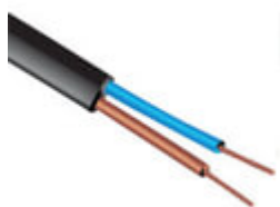
cavo senza spina