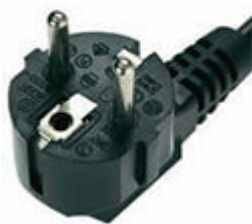
Cavo con spina Schuko