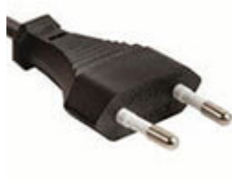
cavo con spina Euro A10