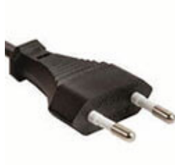
cavo con spina Euro A10