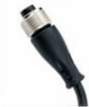
Connettore dritto con cavo 5mt