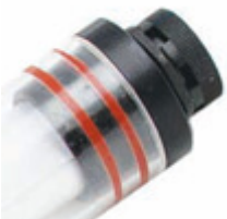
Valvola GORE sul tappo di chiusura