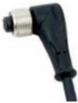
Connettore a 90° con cavo 5mt