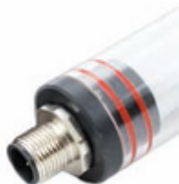
Connettore M12 a 4-poli