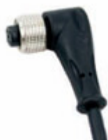
Connettore a 90° con cavo 5mt