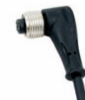
Connettore a 90° con cavo 5mt